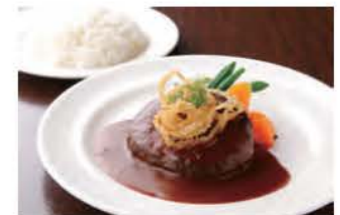
◆ 自家製ハンバーグ