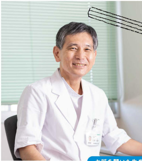
お話を聞いた先生