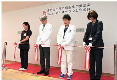
図2 1階外来の一部を改築し病床を12床に増床し化学療法室をリニューアル、そして令和7年1月から運用を開始します。

近年、がん治療の進歩により、外来での化学療法を受ける患者さんが増加しており、当院でも2020年度は846件だったのが2022年度は1,000件を超え、2023年度は1,614件と大幅に増加しており、2024年度も1,472件になる見込みです(図1)。このように化学療法患者数の増加に伴い化学療法室の拡充に努めており、2021年4月より6階西病棟の4床部屋を利用して1階外来と併せて7床で運用を開始し、2022年4月からはさらに6階西病棟の2床部屋を追加し合計8床で運用を続けてまいりました(図2)。そして今後のさらなる患者さんの増加が予想される中、より快適で安全な治療環境の整備が求められています。そこで1階外来の一部を改築し病床を12床に増床し化学療法室をリニューアル、そして令和7年1月から運用を開始します。